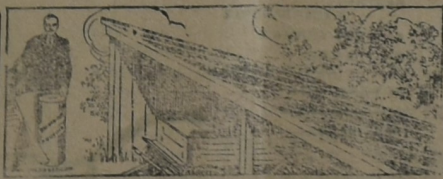
PARA EL GALPON