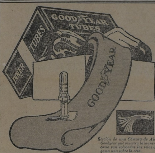
Sección de una Cámara de Aire Goodyear que muestra la manera como son colocadas las telas de goma una sobre la otra.

Para la seguridad de sus neumáticos compre Cámaras de Aire Goodyear