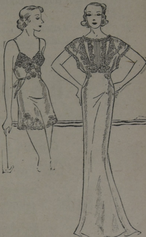
Dos atrayentes creaciones en ropa interior realizadas en fina seda con aplicaciones en relieve.

pular en el ambiente juvenil y es esperado con el entusiasmo que provoca la posibilidad de revivir en toda su lozaura un recuerdo sumamente grato y emotivo.