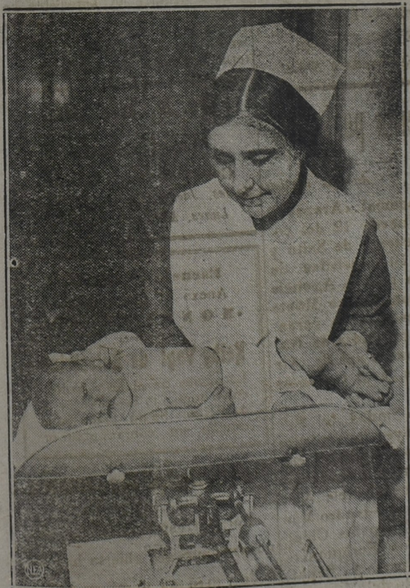
Pequeño hijo de los Duques de Kent al ser pesado, operación que se realiza celosamente todos los días.—Este sobrino del actual rey, Eduardo VIII, ocupa el sexto lugar en la escuela de los herederos del trono.