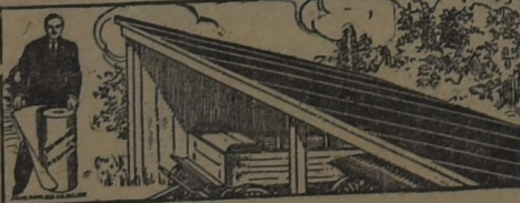
PARA EL GALPÓN