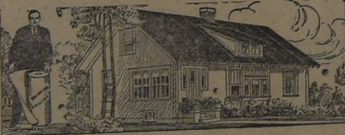
PARA LA HABITACIÓN

AL principio, hace ya muchos años, cuando iniciamos la importación de este techado, los interesados lo compraban como para hacer experimentos. Hoy, que los años y la práctica lo han consagrado como el techo ideal para toda clase de construcciones, sin excepción, su uso se ha generalizado a tal punto que muchas veces la demanda supera la importación. Y si el artículo no fuera de primer orden, no lo venderíamos nosotros.