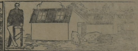
PARA CHIQUEROS, GALLINEROS, ETC

Enviamos, a solicitud, muestras de los diferentes tipos, instrucciones para su colocación, precios y demás detalles de interés.