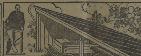
PARA EL GALPÓN