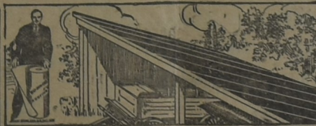
PARA EL GALPÓN