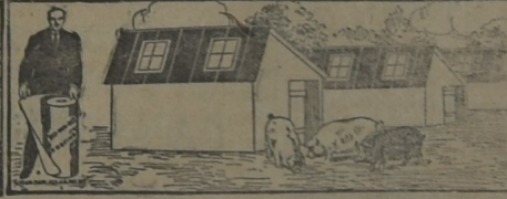
PARA CHIQUEROS, GALLINEROS, ETC.

Enviamos, a solicitud, muestras de los diferentes tipos, instrucciones para su colocación, precios y demás detalles de interés.