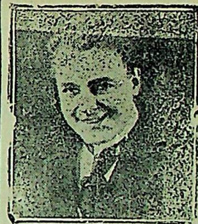
Esta gran película del coloso de la cinematografía, William Farnun, será pasada esta noche