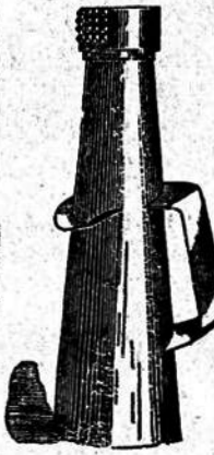
APARATO PARA CUBIR LA GARRA Á MAYO