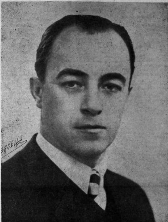
Jóven estadista de excepcional capacidad, que acompañará a Baldomir en el futuro gobierno.

El Estatuto del Funcionario, perfeccionará los servicios públicos, pero fundamentalmente ha de perfeccionar la