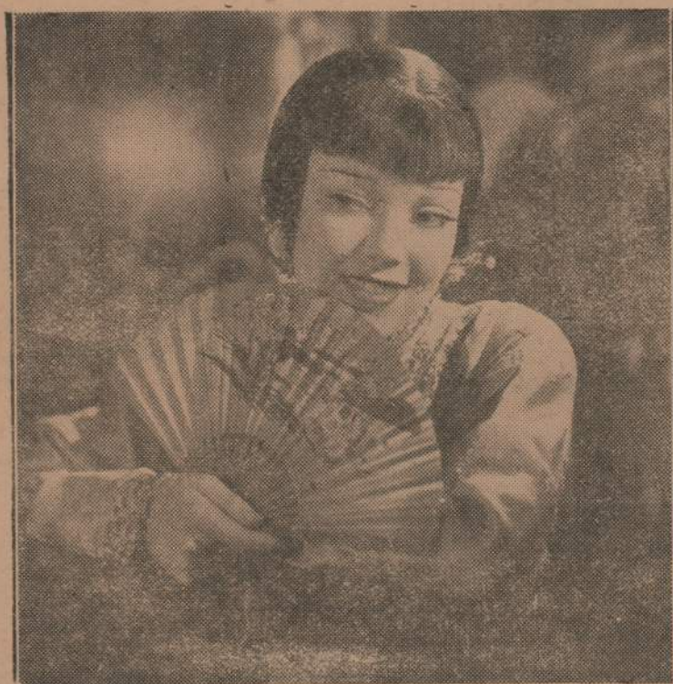
(arriba) Bárbara Stanwyck. (medio izquierda) Lily Damita. (derecha) Marian Marsh. (abajo) Loreta Young.