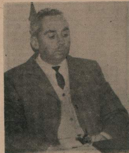
MARIONE: La liberación económica.

guay puede y debe producir: algodón, tabaco, yerba mate, té, café; pero éstas son producciones a las que se oponen los intereses trustificados.” “Encarar su producción con fe y con valentía, es iniciar nuestro camino de liberación económica.”