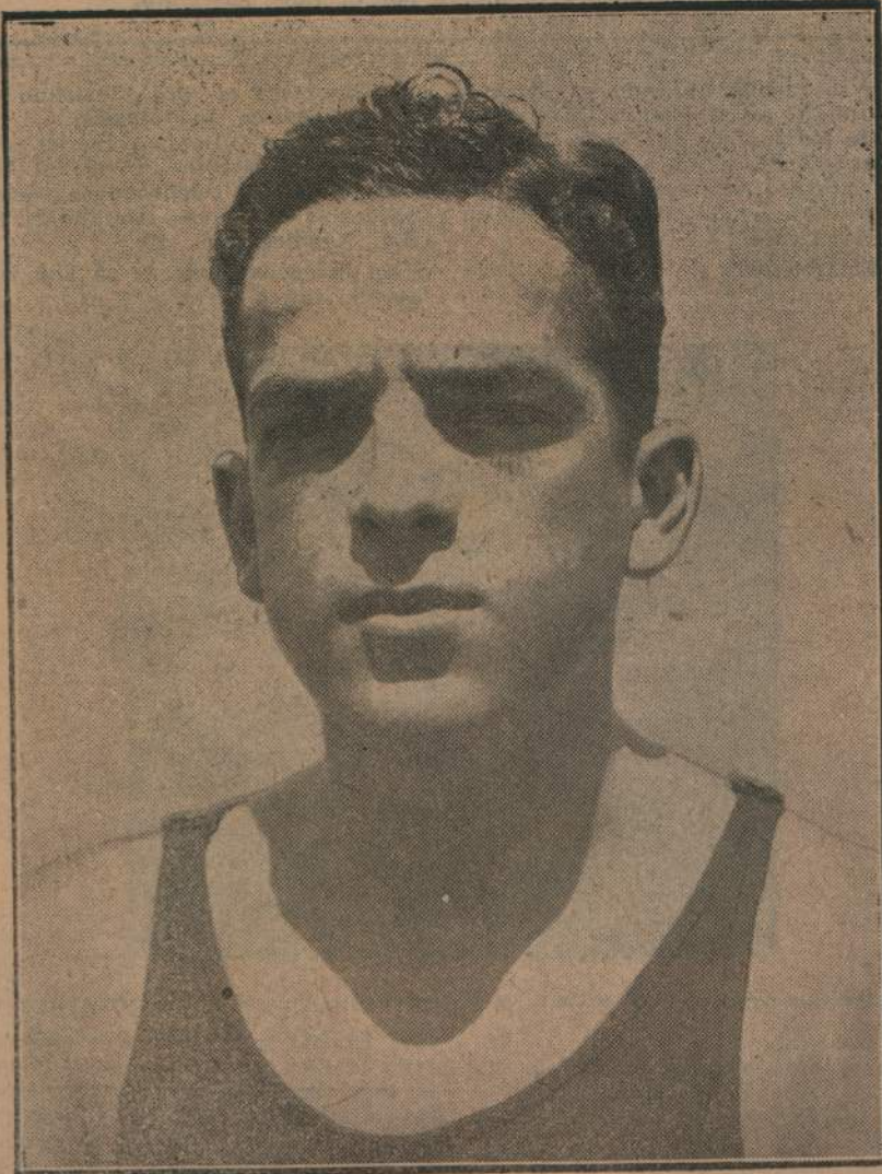
Alberto Zorrilla, recordman argentino de los 100 metros libre

Zorrilla bate el record nacional de los 100 metros