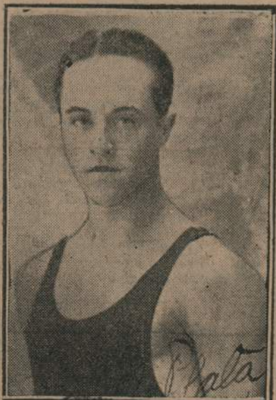
Vito Dumas, recordman mundial de permanencia

Una entidad aghena al deporte fué la encargada de patrocinar el nuevo