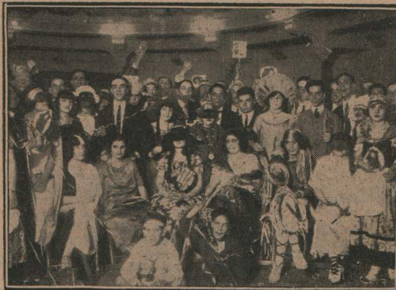
Una parte de la concurrencia que asistió al gran baile del 10

Viernes — Descanso. El peso de los jugadores es controlado y vigilado. Los tobillos y las rodillas son medidas para juzgar por la hinchazón la importancia de las lesiones que se produzcan. Respecto á la