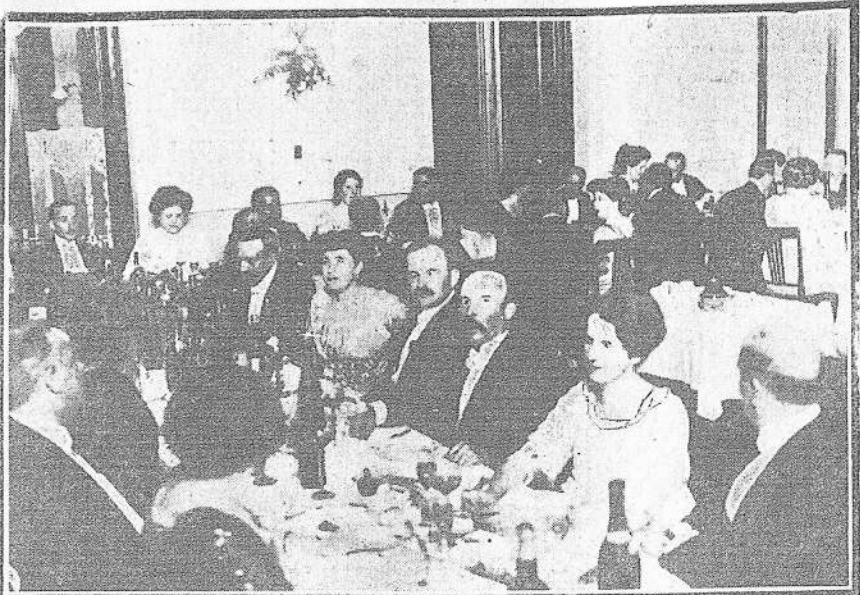
y Señora. Al desgranarse el champagne al ruido.