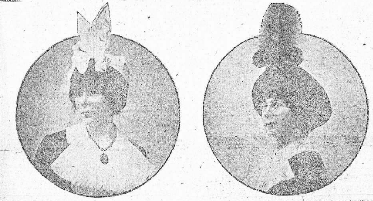
5.—Tratado de comida de "Liberty" blanco. 6.—Tratado de comida de "Liberty" blanco. 7.—Tratado de comida de "Liberty" blanco. 8.—Tratado de comida de "Liberty" blanco.