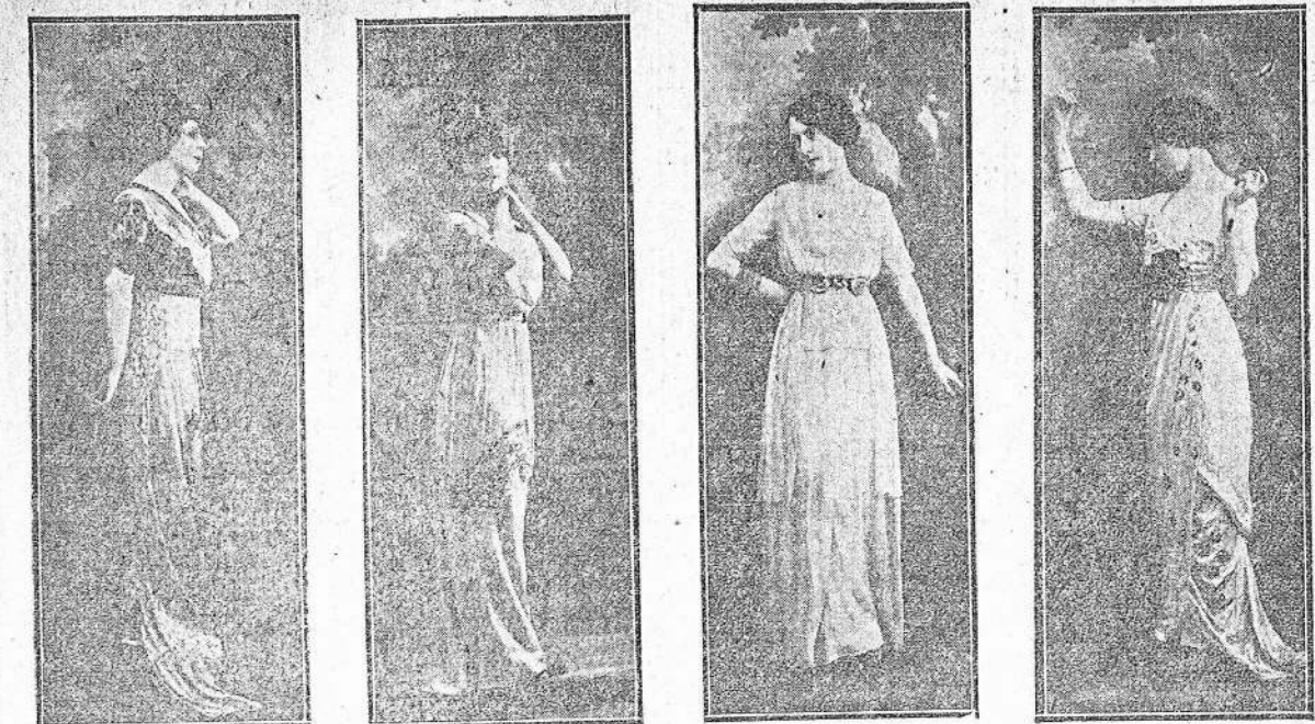
1.—Tratado de comida de "Liberty" blanco. 2.—Tratado de comida de "Liberty" blanco. 3.—Tratado de comida de "Liberty" blanco. 4.—Tratado de comida de "Liberty" blanco.