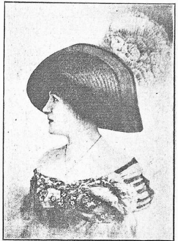
SOMBRERO DE PAJA ADORNADO DE UN GRAN CHOQUE DE TEL