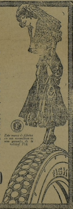
Esta marca de fábrica en sus neumáticos es una garantía de la calidad Fisk

Recomendamos con el mayor entu- siasmo los neumáticos "RED TOP" de Fisk.