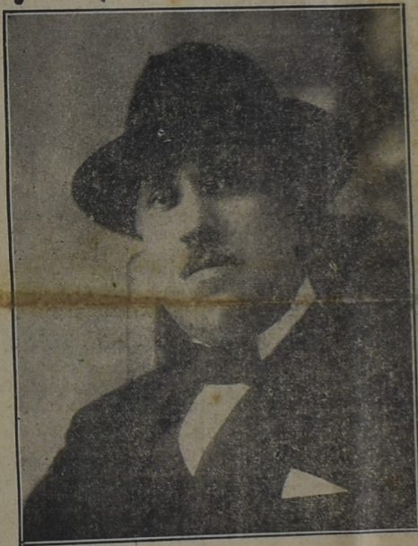
Dr. EMILIO FRUGONI Candidato del Partido Obrero Socialista del Uruguay a Diputado Nacional

La mortalidad general ha disminuido en todos los estados de la gran república americana, calculándose que el término medio de la vida ha aumentado en tres años, pero especialmente la mortalidad infantil ofrece cifras alentadoras; los nacidos muertos han bajado de un 7 por ciento con respecto a lo que ocurría anteriormente: esa baja llega al 25 por ciento tratándose de niños de un año de edad, y al 40 por