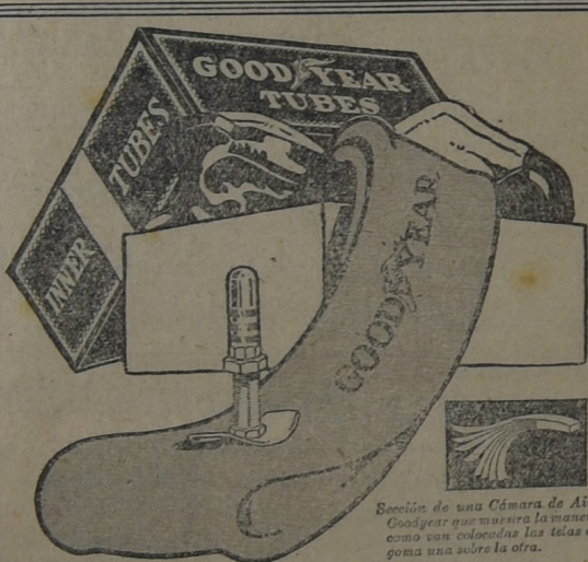
Sección de una Cámara de Aire Goodyear que muestra la manera como van colocadas las telas de goma una sobre la otra.

Casa de comercio bien surtida y de ventas al contado Cuando no encuentre el artículo que busca, si no ha ido a lo de- fecto no desespere, pues muchas veces encontrará en su casa lo que no se halla en ninguna parte, Reparto a Domicilio telefono "La Unión" N.º 78