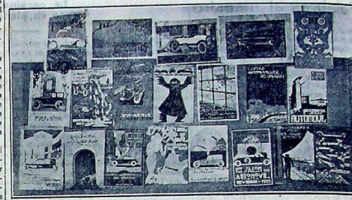
El conjunto de afiches presentados al concurso del Centro Automovilista del Uruguay, para anunciar el primer Salón de Automóviles, que se inaugura el 1.º de Diciembre

Seguendo estas advertencias, y ciertas otras que su instinto le dictará, el invitado prolongará su carrera de invitado y podrá aguardar a que se procure un coche propio, que los constructores hayan encontrado el tipo definitivo que espera hace años ya.