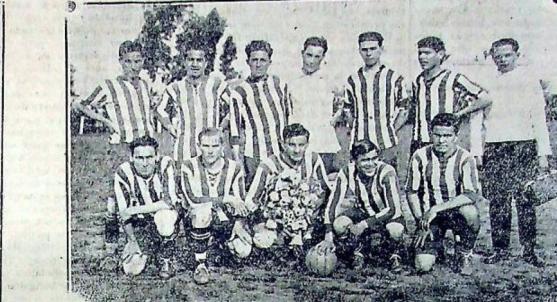
El internacional paraguayo que después de remus lucen vendió a los nuestros por 2 a 1