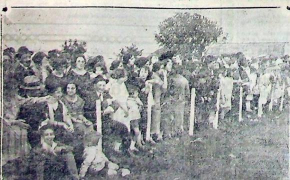
Demás conocidas que marginaban el field en la tarde del 7

Y bien. Los maragatos, señores palmaristas, han jugado con los paraguayos, quienes intervinieron nada menos que en la disputa de la Copa