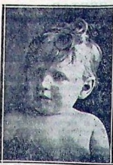
Niño de ABO-COSTA PUG