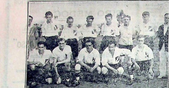
El bravo conjunto maragato que se hizo acreedor a calurosos elogios por su destacada actuación frente al team paraguayo

Humberto L. Castelli ABOGADO. —MONTEVIDEO. Calle 1922. SAN JOSÉ: 18 de Julio 357.