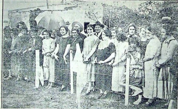
Un entusiasta conjunto femenino que tanto lucimiento dió a la fiesta internacional con su asistencia al Parque Artigas

Y bien. Los maragatos, señores palmaristas, han jugado con los paraguayos, quienes intervinieron nada menos que en la disputa de la Copa