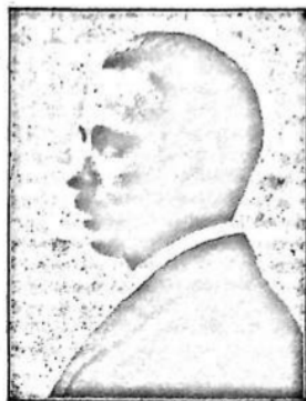
C. VIGIL, autor de la composición

Terminemos el año brufiendo la voluntad para la nueva batalla. ¡Que la bondad divina descienda en mayor porción sobre la especie! ¡Que sean más buenos los buenos, para que el amor rebese de sus con- tornos y se infiltre hasta en las frentes que hablan, y las amane- re! ¡Que redoblen su afán los plantadores de la buena simiente para que no quede un palmo don- de puedan crecer las malas hier-