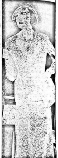
NANCY CARROLL, víctima de un accidente

ANNABELLA ENFERMA Ha sido hospitalizada la actriz de cine Annabella, aquejada de trastornos intestinales.