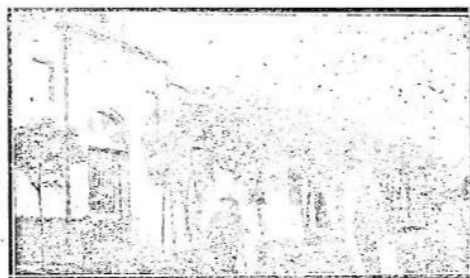
Frente Colegio Maria Auxiliadora