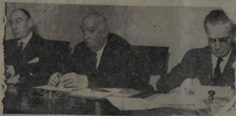
Presidiendo una reunión en el Palace Hotel de Buenos Aires, con motivo de la adhesión de su partido a la causa Franco-Británica.

del túnel de la vía férrea cercana a la Estación Bañado de Rocha, a una persona de nacionalidad alemana, cuya identidad se ignora.