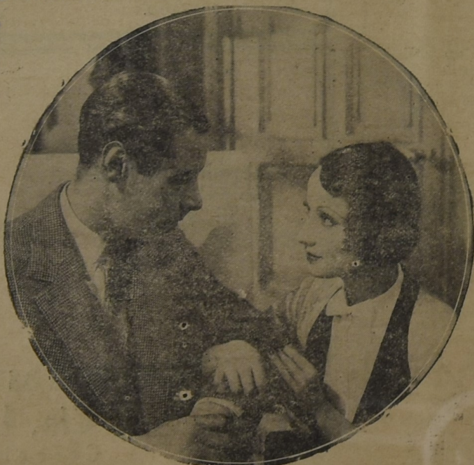
OLIVIA de HAVILLAND, en una de sus últimas producciones y que en breve la veremos en la pantalla del nuevo "Cine Atenas", «Nubes sobre Europa»