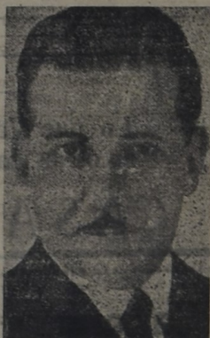
Gral. Alfredo Baldomir

Domingo 29. — A las 10 horas solemne Tedeum en la Catedral. A las 10.30. Visita del Presidente a distintos Centros Industriales. A las 12 horas, recepción en la Jefatura de Policía. A las 15 horas, inauguración del Monumento al General Artigas, concepción del escultor Edmundo Pratti. A las 16 horas, Desfile Militar. A las 19 horas, concier-