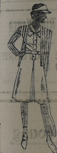
Este vestido chemisier para tenis tiene varos grupos de tablas adelante en la pollera y se usa con un saquito de rayas.