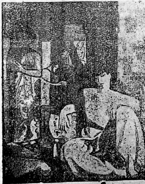
COMPOSICION por ANTONIO VIERA