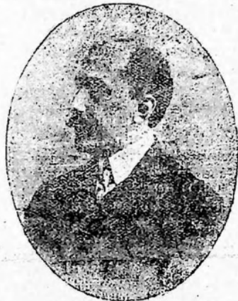
Doctor Blas Vidal Ministro de Hacienda