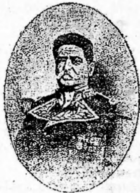
General Eduardo Vazquez Ministro de la Guerra

Nada más sugestivo para la vida del hombre, que el comienzo de un año nuevo, y toda la humanidad, optimistas y pesimistas, ansían con vehemencia su llegada, con la esperanza halagadora de contemplar en el camino de la realidad, sus afanes y sus empeños, sus proyectos y sus anhelos, acariciados tan dulcemente, hora por hora, día por día, en el transcurso del año que se fué.