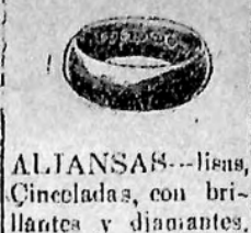
ALIANZAS—lilas, Cinceladas, con brillantes y diamantes.