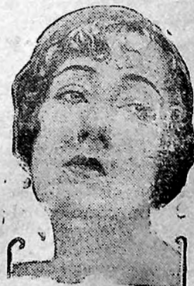
Gloria Swanson ROD LA ROCQUE RICARDO CORTEZ