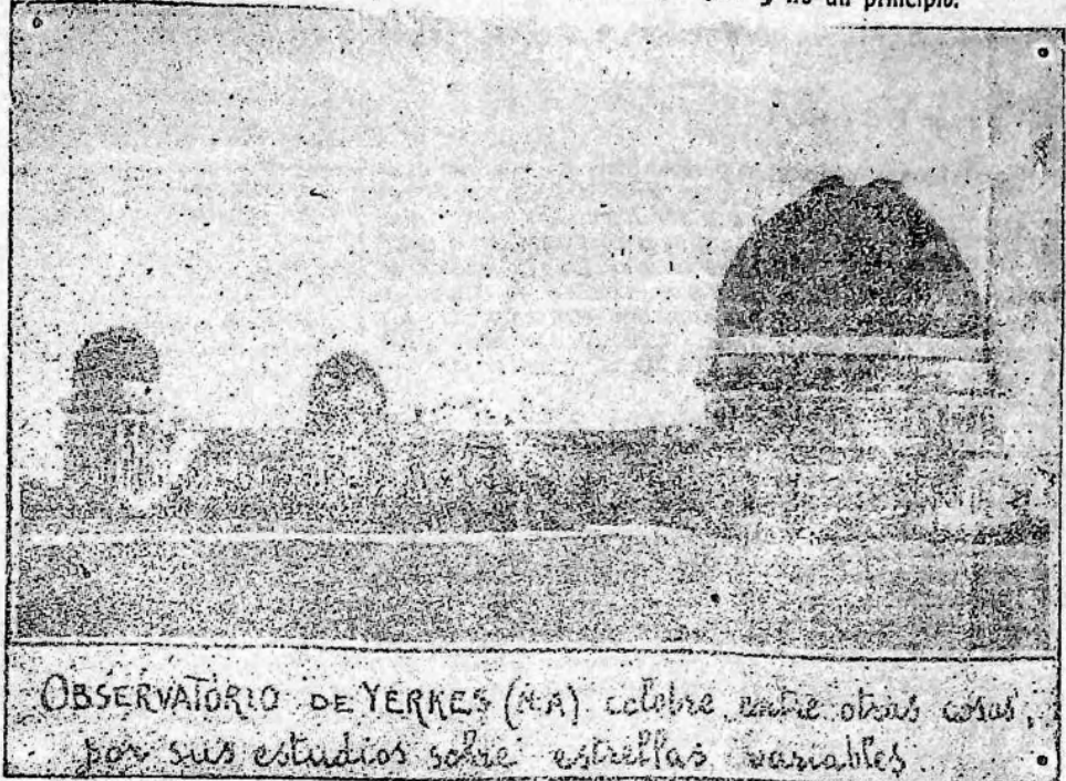
OBSERVATORIO DE YERKES (U.S.A.) celebre entre otras cosas por sus estudios sobre estrellas variables.