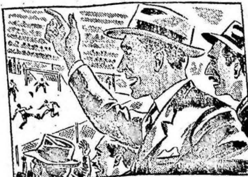
Esa tarde presencié el partido de fútbol más emocionante que recuerdo...