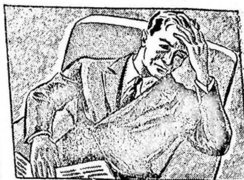
...llegué a casa cansado, nervioso, con un dolor de cabeza inaguantable.