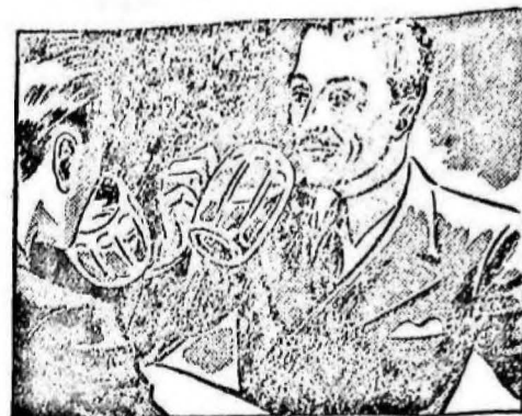
La noche anterior estuve con unos ami- gos en el café y me acosté muy tarde...