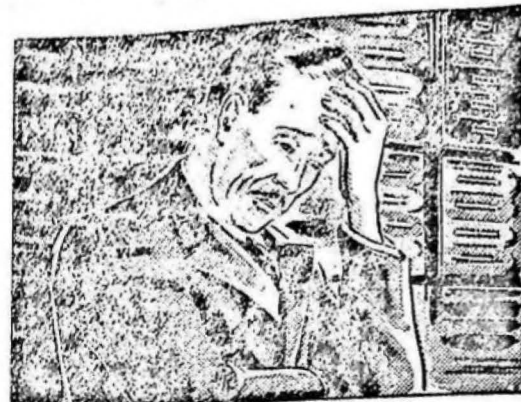
...estaba cansado, sin ánimo para traba- jar y con un dolor de cabeza insoportable