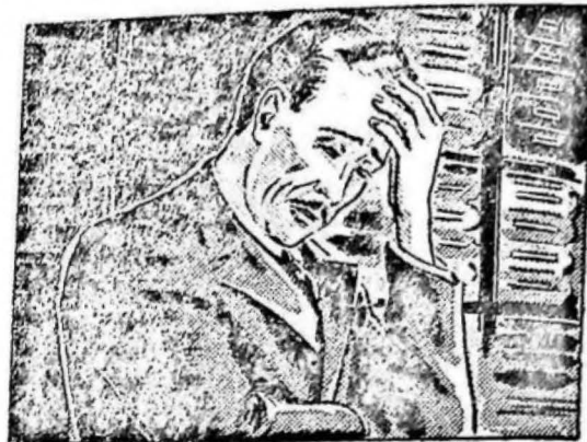
...estaba cansado, sin ánimo para trabajar y con un dolor de cabeza insoportable