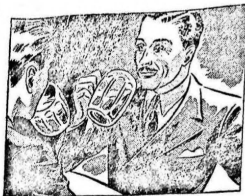
La noche anterior estuve con unos amigos en el café y me acosté muy tarde...

De la misma manera, es de toda evidencia, que en tanto el "standard", digamos, de la existencia colectiva es muy superior en la capital del país, en razón de que en ella se hallan concentrados todos los servicios y los elementos de atracción de todo