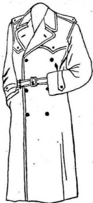
TRINCHERA forro entero forrasol $ 38.00