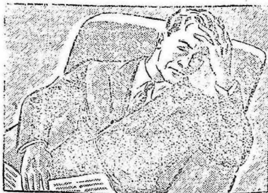
...llegué a casa cansado, nervioso con un dolor de cabeza inaguantable.