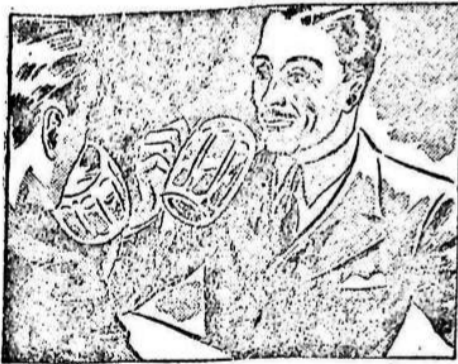
La noche anterior estuve con unos amigos en el café y me acosté muy tarde...