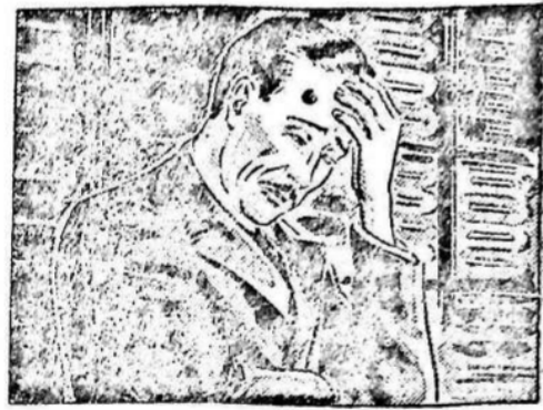
...estaba cansado, sin ánimo para trabajar y con un dolor de cabeza insoportable