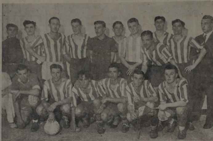
El equipo Vice Campeón Nacional que este año en el Campeonato del Litoral ha defecionado frente a bravos contendientes.