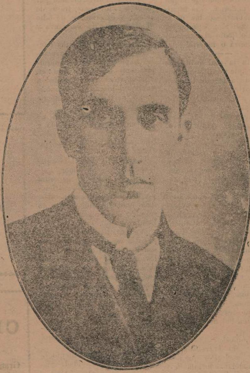
CESAR BATLLE PACHECO

Realizará desde su puesto del Concejo Departamental una obra netamente batllista, con el consiguiente beneficio para el pueblo. Sus amigos le preparan un homenaje al que, desde ya se adhiere EL BALUARTE.