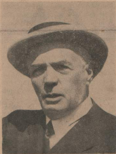
Dr. GABRIEL TERRA

Su obra, en medio del aplauso y de la gratitud de sus contemporáneos, pasa definitivamente a la consagración justiciera de la historia.