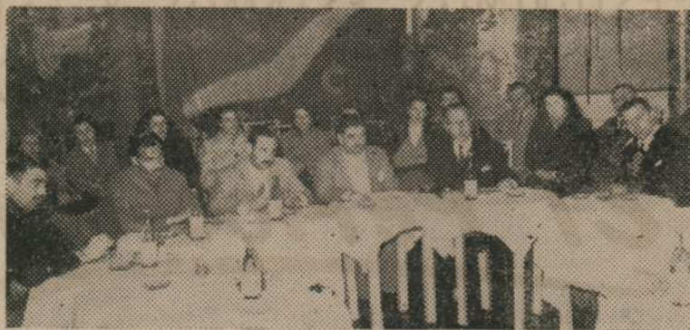
Un aspecto de la mesa redonda de periodistas que han viajado a Europa y Estados Unidos, que se realizó el 24 de agosto en el Cantegril de Punta del Este.

Con esta Mesa Redonda, en la que intervinieron periodistas de las más diversas tendencias glorificando la realidad internacional e interna de países diferentes (incluso los del bloque europeo oriental), nuestra Asociación ha sentado un valioso precedente. Además de cumplir una de sus