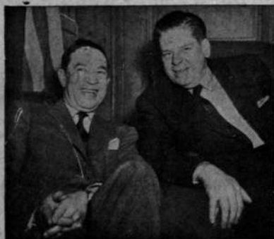
En el Capitolio de los Estados Unidos en Washington, Luis Muñoz Marín, Gobernador de Puerto Rico (izquierda), conversa con Joseph W. Martin, Presidente de la Cámara de Representantes (derecha).

"Yo, Dwight D. Eisenhower, Presidente de los Estados Unidos de América, proclamo aquí el miércoles 14 de abril de 1954, como el Día Panamericano, para que sea celebrado por el pueblo de esta nación como el día de las Américas y un día señalado para expresar esa buena voluntad hacia los otros pueblos americanos y esa fe en nuestra mutua adhesión a los principios de libertad y democracia que han inspirado nuestra independencia como naciones y cimentado nuestra cooperación como vecinos. Convoco a los funcionarios de los gobiernos Federal, estatales y locales; representantes de organizaciones cívicas, educacionales y religiosas; agencias de la prensa, radio, televisión, cine y otros medios de comunicación; y a todo el pueblo de los Estados Unidos de América, que cooperen en las conmemoraciones del Día Panamericano, por medio de ceremonias u otras actividades públicas apropiadas a la ocasión, como un símbolo de la solidaridad interamericana".