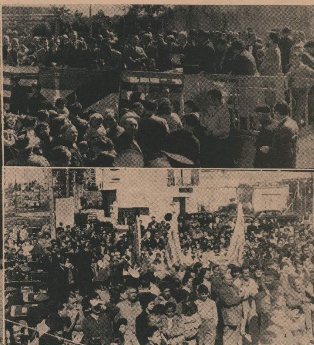
(Por gentileza de el diario "El Día", aparecido el día 10 de setiembre próx. pdo)

"LA PALABRA" NO PRODUCE GANACIAS. CUANDO DEJA UN SALDO A FAVOR SE INVIERTE EN MEJORAR Y AUMENTAR EL TIRAJE DE LA PROXIMA EDICION