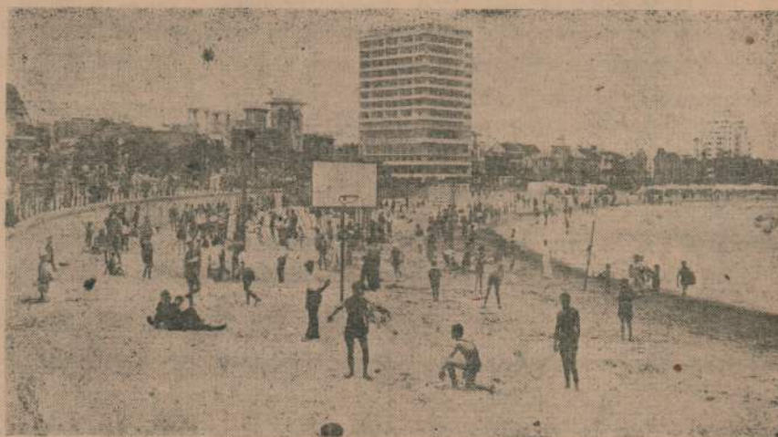
PLAYA DE LOS POCITOS