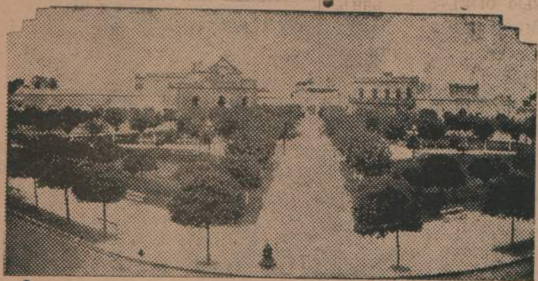
ДОЛОРЕСЬ — Соріано.

Знаете ли вы украинскую ночь? О, вы не знаете украинской ночи! Всмотритесь въ нее. Съ середины неба глядитъ мѣсяць. Необъятный небесный сводъ раздался, раздвинулся еще необъятнѣе. Горитъ и