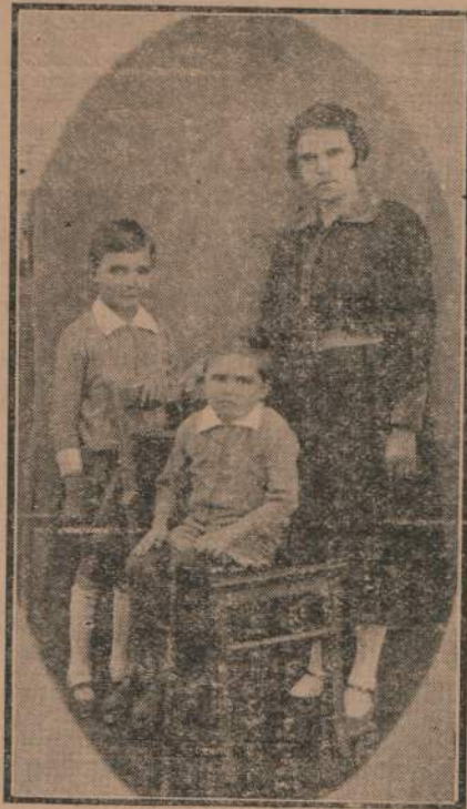
33 días después de terminado el ayuno