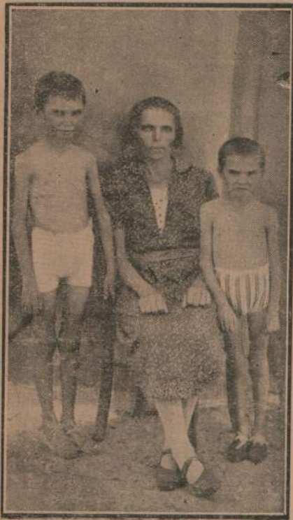
42 días de ayuno completo

Es notable el hecho de que la mayor parte de los ayunos forzosos hasta los de larga duración, no reviste peligro de ninguna clase, siempre que no intervengan factores especiales e inherentes al ayuno, los cuales podrían perturbar el proceso del mismo.