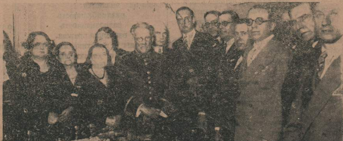
Празднованіе «Дня Расы» клубомъ «Дефенса Популаръ» Присутствуютъ представители «Русской Мысли» Club «Defensa Popular»