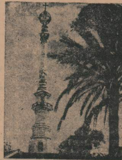
Un Monumento Español

La segunda de las recepciones, se realizó en la noche del 26, siendo organizada por un núcleo de "Jeune Feminas" de nuestra sociedad, recepción que reavivó el viejo brillo en los aristocráticos salones del viejo Club Uruguay.