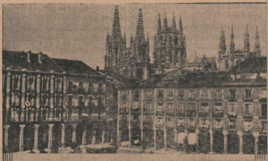
La célebre catedral de Burgos, joya del arte hispano y justo orgullo del pueblo burgalés.