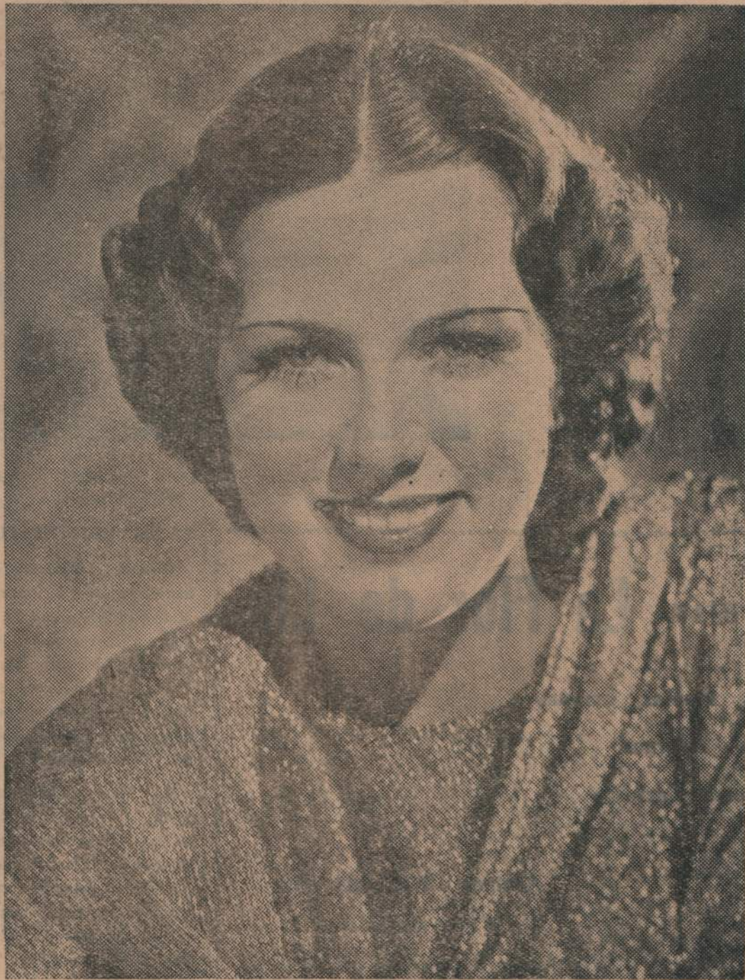
Eleanor Powell, la exquisita estrella de la producción musical "La Melodía de Broadway 1936".