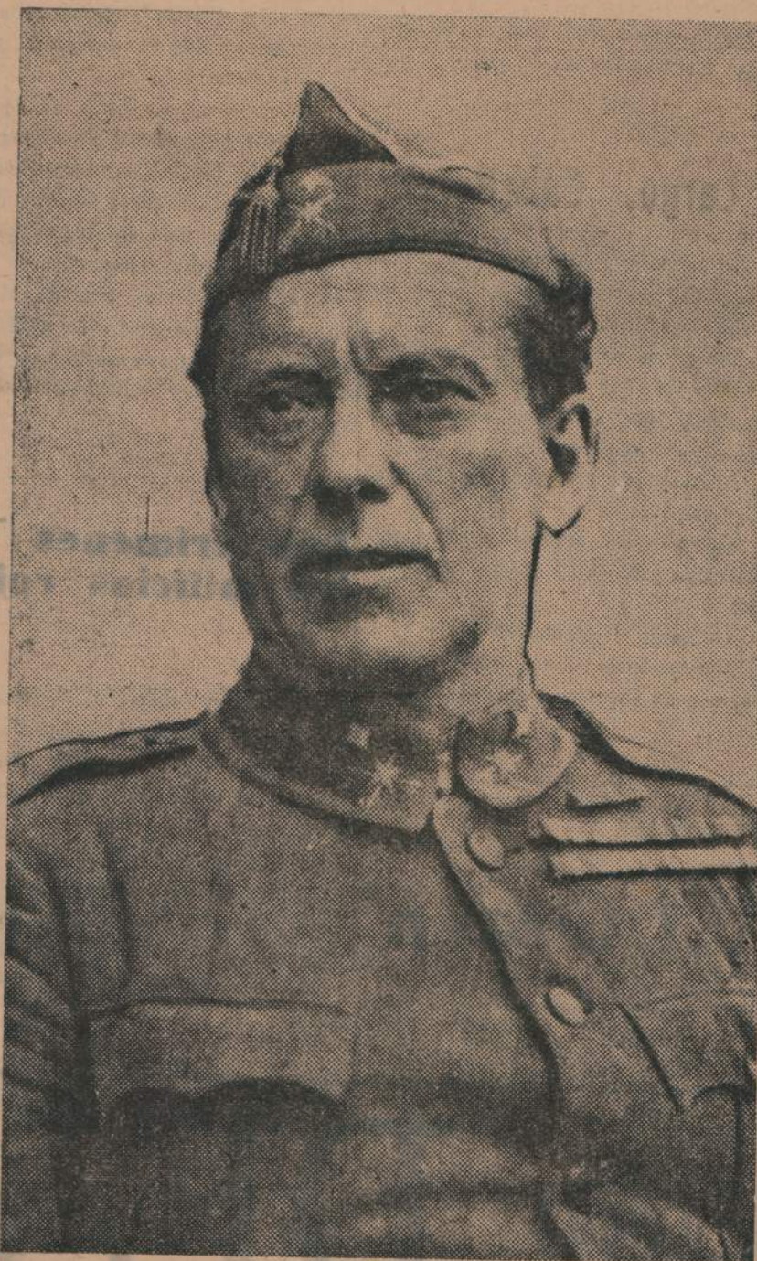
El valiente general español, López Ochoa, bárbaramente asesinado en el hospital de Carabanchel.

“Y aquí estoy por milagro. Mi salvador me dijo que se jugaba la vida por mí, pero que no le importaba. Es- (Cont. en la pág. 5)