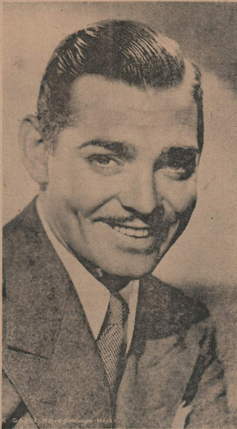
Clark Gable, el varonil galán que interpreta "En Mares de la China" todo un éxito en su carrera

Tales, los rasgos salientes de bella producción musical. "La Melodía de Broadway 1936".