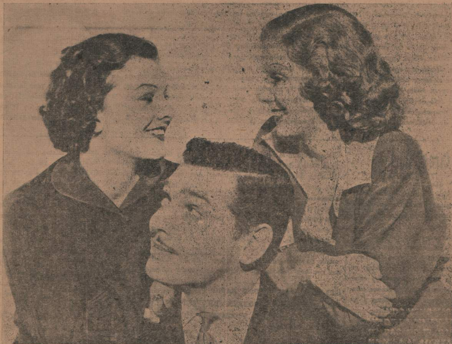
Una escena de "Entre Esposa y Secretaria", estreno próximo en el Cine Metro, donde se lucen Clark Gable el galán más cotizado del momento en compañía de Jean Harlow y Myrna Loy, dos actrices de las mejores del abundante conjunto de la Metro Goldwyn Mayer. "Entre Esposa y Secretaria" viene precedida de las mejores opiniones de los críticos de Buenos Aires, donde obtuvo gran suceso.

Tenemos el ejemplo del gran circo CARL HAGENBERCK. Los gastos de empleados, obreros, de más de 200 artistas, la manutención de 30 capitales que son de difícil tratamiento de alimentación los gastos de transportes de 150 coches que miden de 5 a 10 metros de largo cada uno los gastos de luz, agua, impuestos, reclame necesitan de la disposición de capitales millonarios.