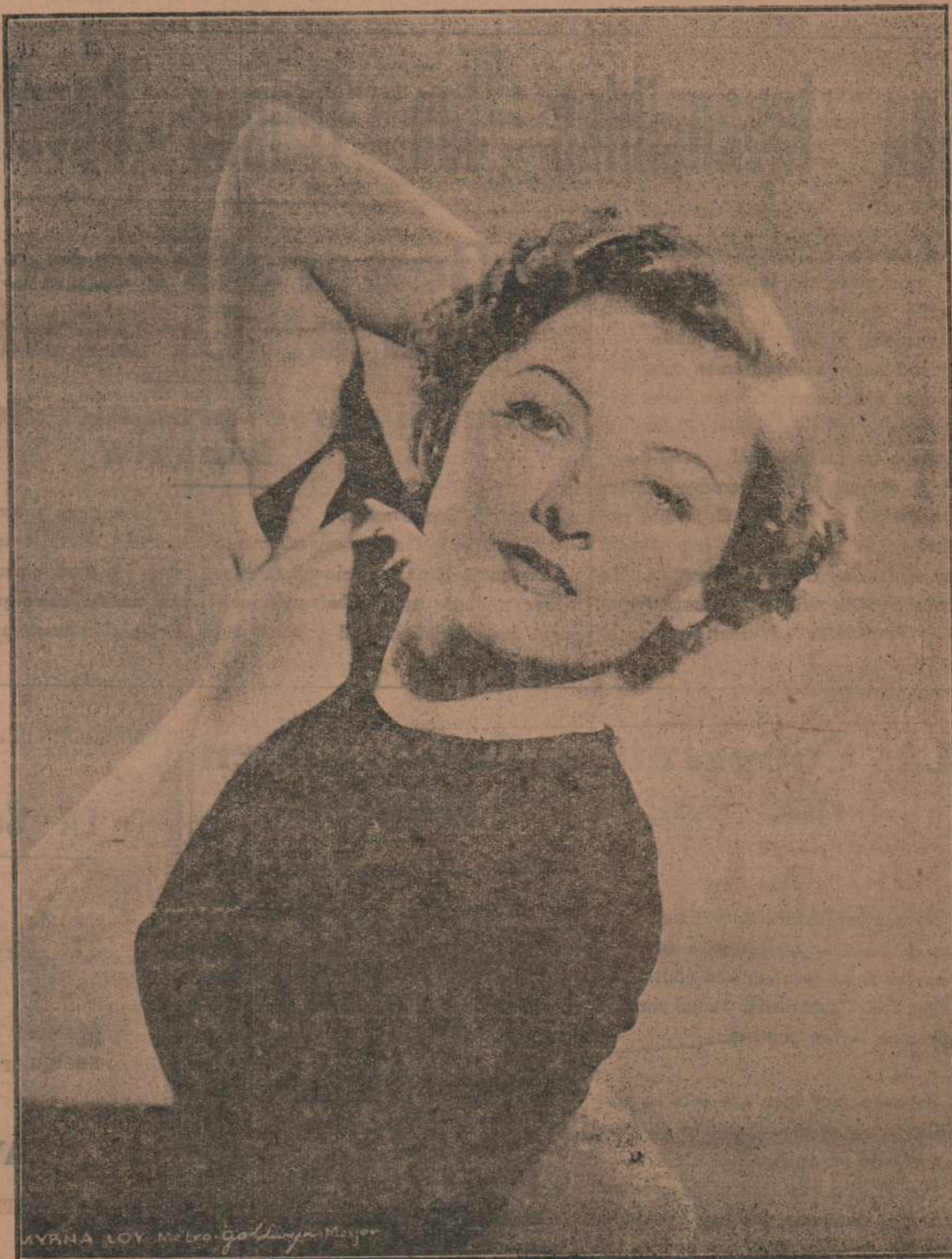
MYRNA LOY, la estrella que fulgura una vez más interpretando el papel principal de "JAQUE AL REY" (WHEPSAW) estrenarse en breve en el "Cine Metro"