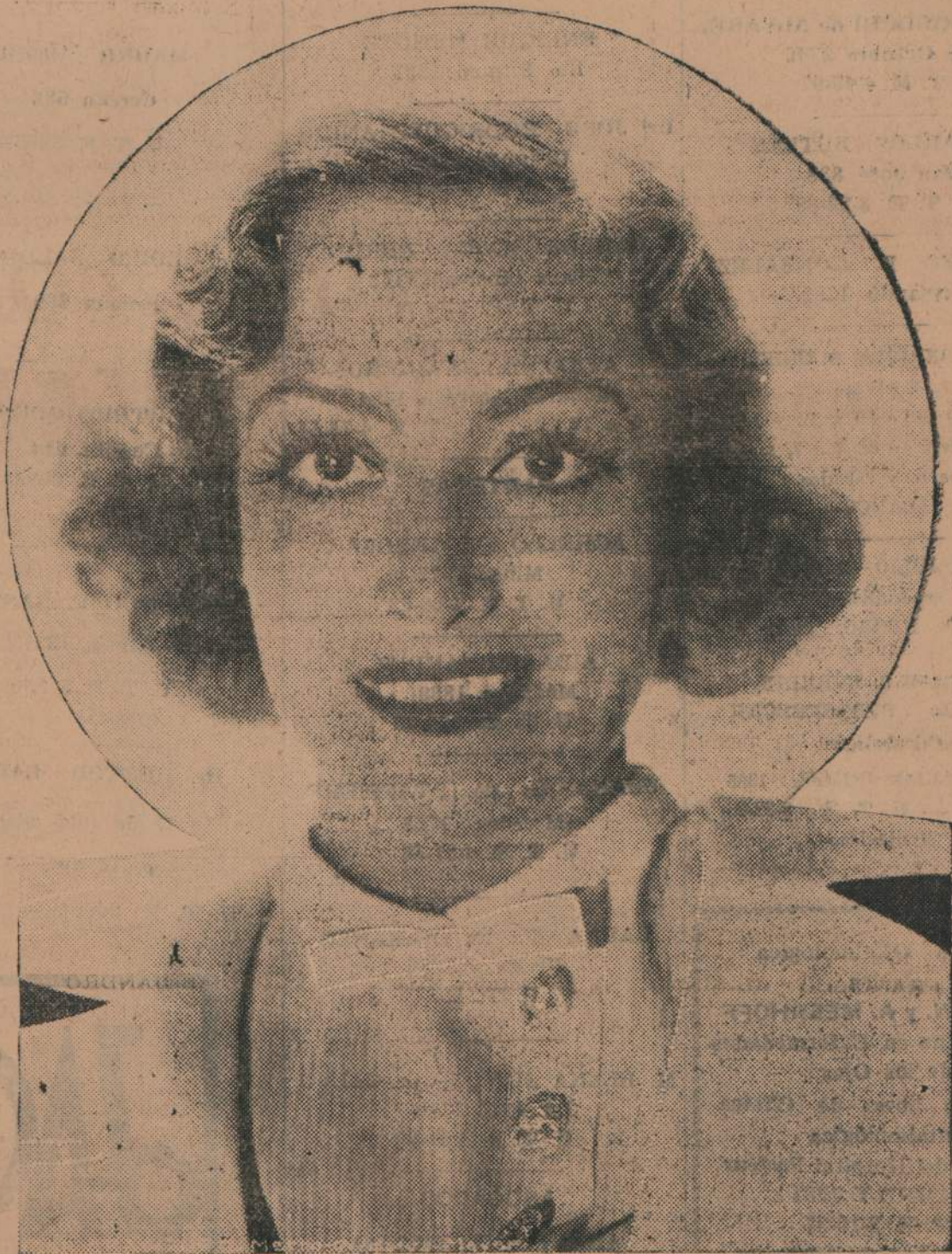
La bellísima Joan Crawford que en la película "No más mujeres" recientemente estrenada en la aristocrática sala la Metro hace el papel principal.

La Administración de este periódico le proporcionará informes convenientes a sus intereses sin gasto alguno para Vd. Solicite informes: CERRITO 643 U.T.E. 8 74 11