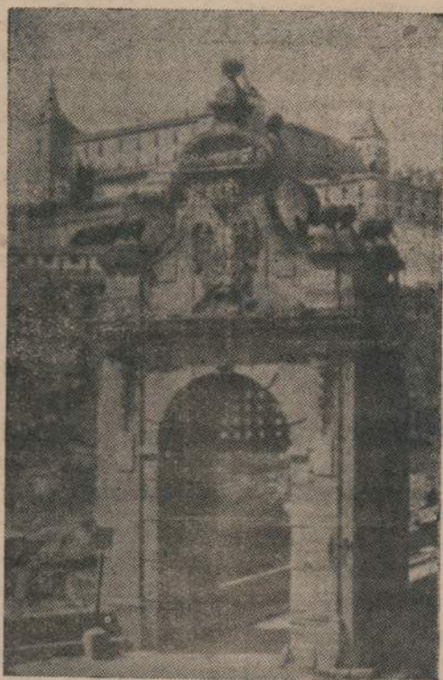
Pórtico del famoso Alcázar de Toledo

En cuanto a la fachada oriental, se remonta al siglo XIV, y remeda un lienzo de muralla almenada, robustecida mole, soberbias galerías dan al gran patio de honor, en cuyo centro, fundida en bronce, se levanta la estatua del Emperador Carlos V. Sabido es que una de las cosas que más admiración causa en el Alcázar es la magnífica esca-