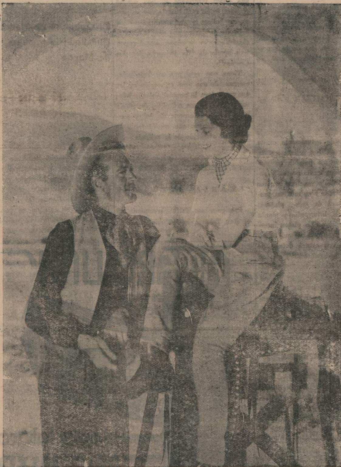
En el estrellado firmamento de Hollywood fulgen estos dos astros: Gary Cooper y la encantadora Sandra Shaw