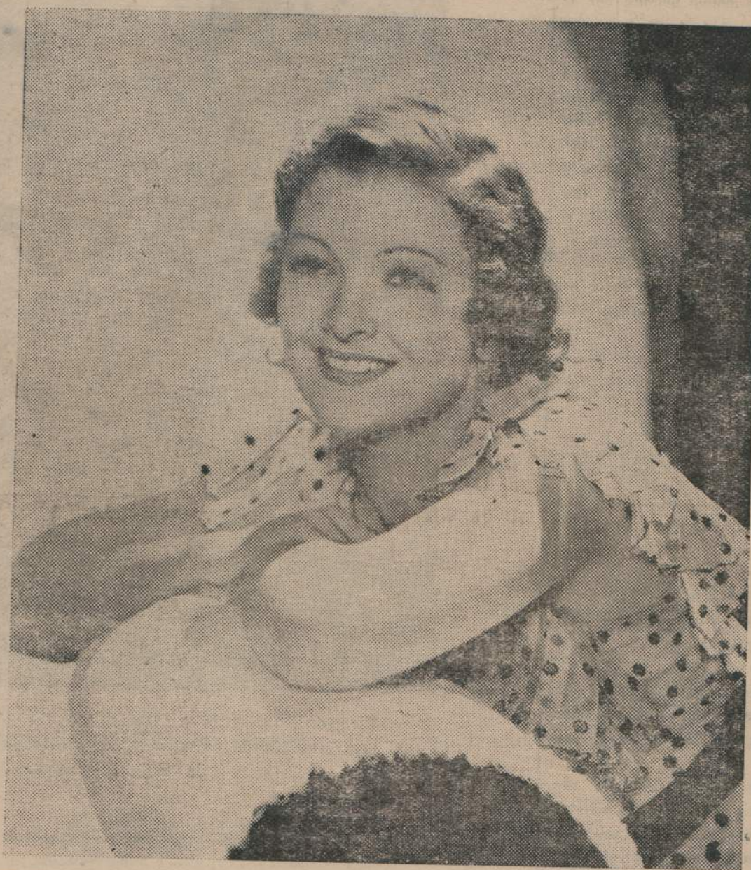
MIRNA LOY SE DESTACA BRILLANTEMENTE EN LA NUEVA PRODUCCION QUE EN BREVE VEREMOS EN LA ARISTOCRATICA SALA DEL "METRO"

En el año que dió fin a la guerra europea. El lugar es Terni, asiento de los más famosos establecimientos metalúrgicos de Italia. El centro de la acción, son los altos hornos de fundición de acero y laminación. Es en ese ambiente realista, donde la tragedia tiene sus acentos más firmes, más hondos, más