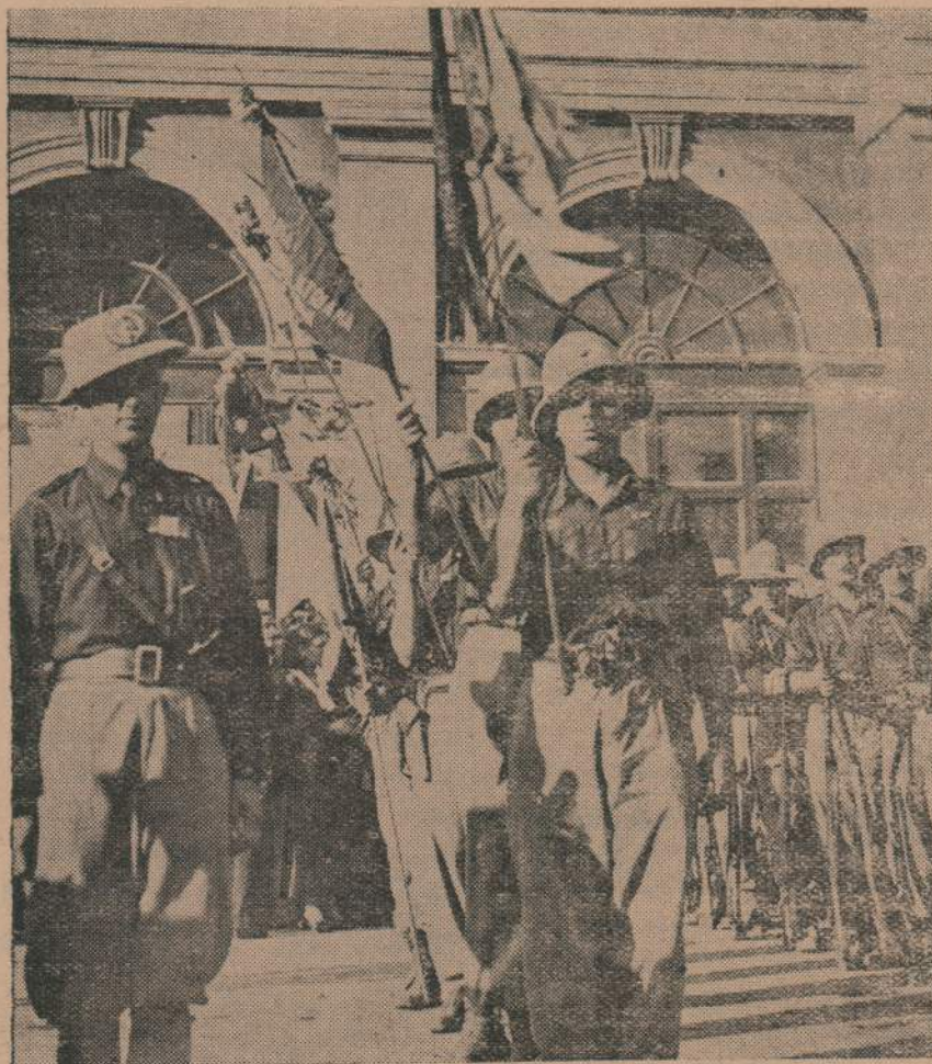
Las banderas del glorioso batallón universitario "Curtatone e Montanara", de regreso a Italia procedentes de los campos de África.

Todo el pueblo italiano respondió con fiereza y con orgullo a las palabras del Duce y cerca de 500.000 hombres, comprendiendo 350 mil soldados y