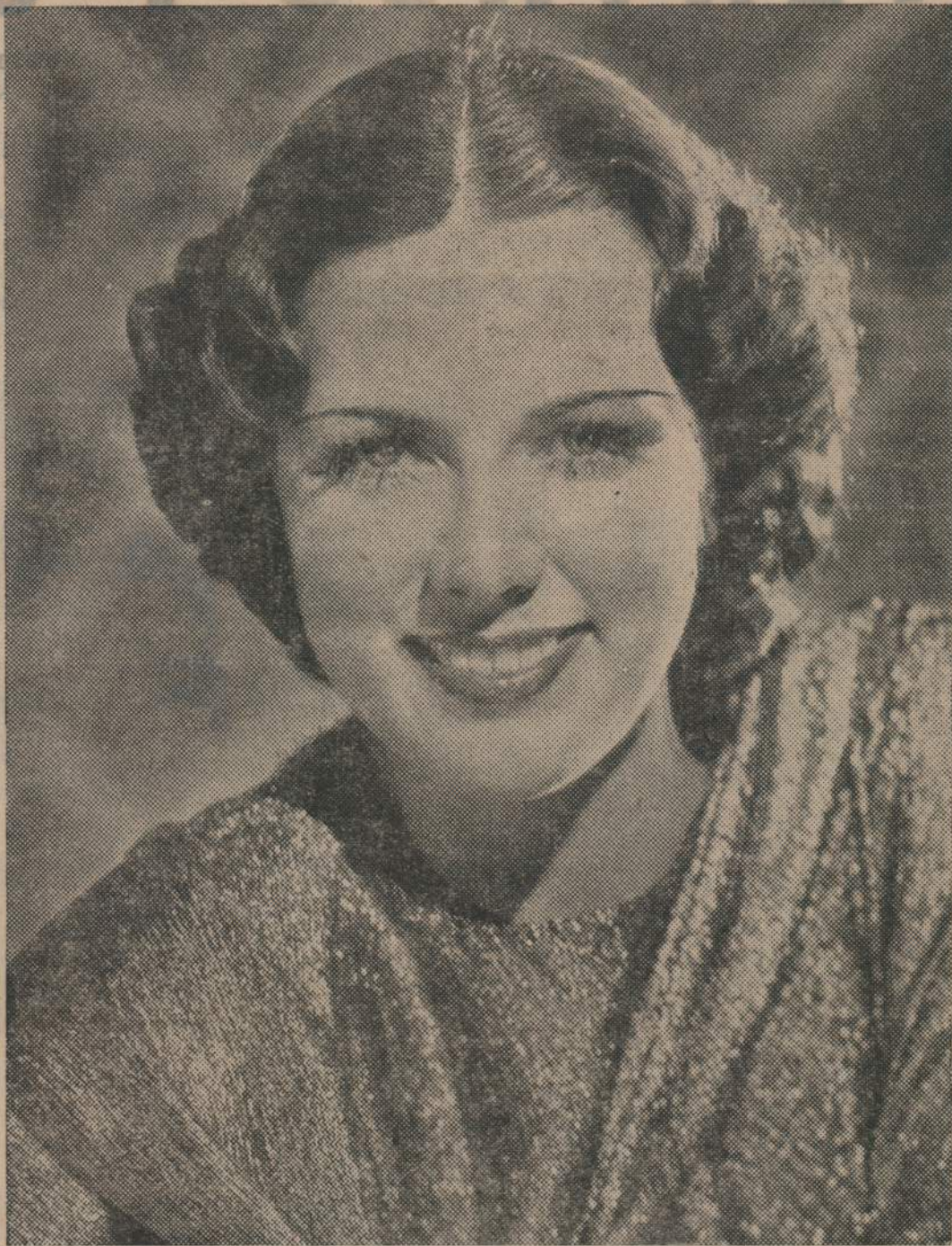
Eleanor Powell, la exquisita estrella de la producción musical "La Melodía de Broadway 1936" estrenada con mucho éxito en la Sala de moda del "Metro"

El judío León Blum, el propulsor del Frente Popular Francés, agitó como bandera de combate para escalar el po-