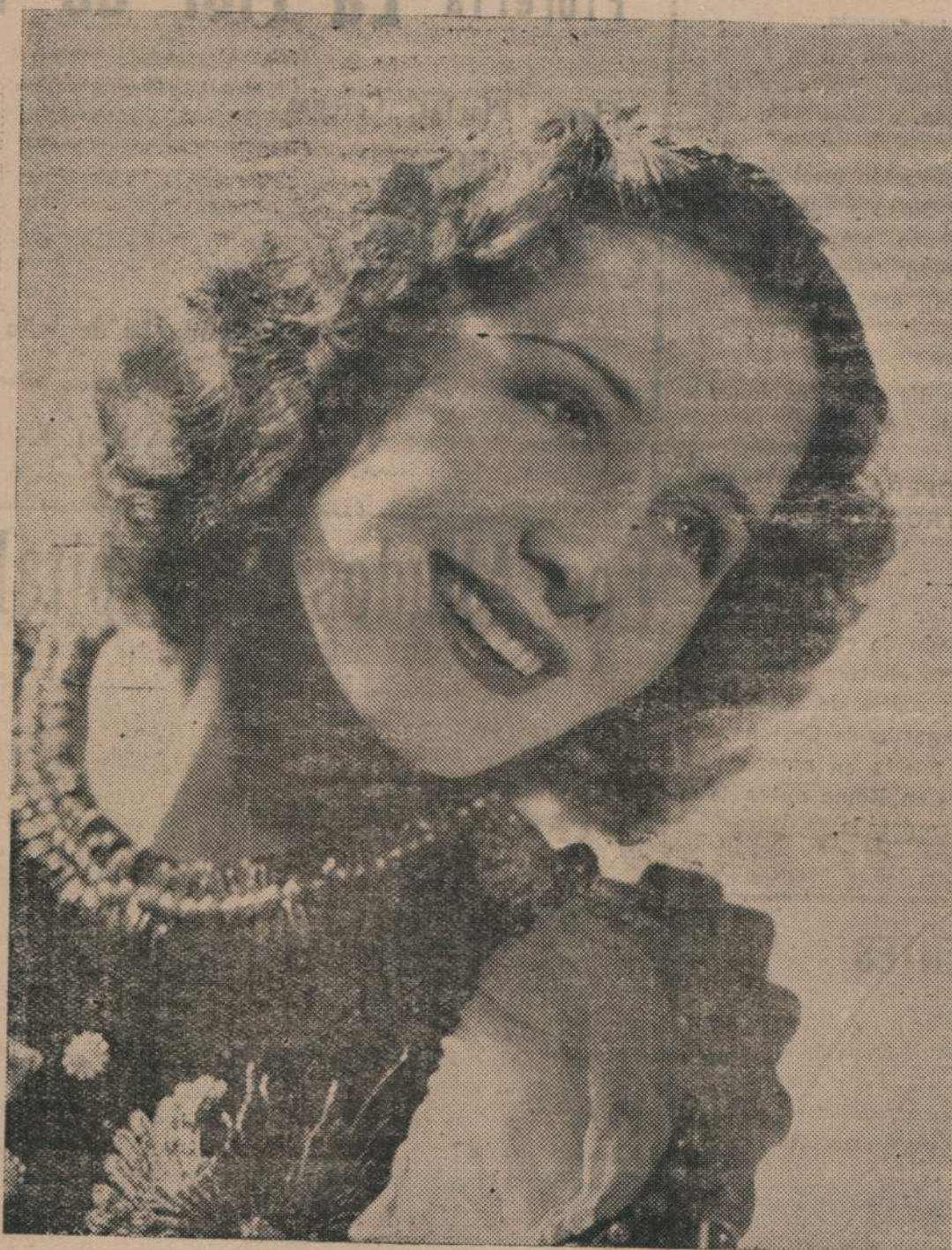
Norma Shearer, estrella de la Metro que cumple una labor extrao ordinaria en la obra cumbre de Shakespeare "Romeo y Julieta", junto con Les lie Howard