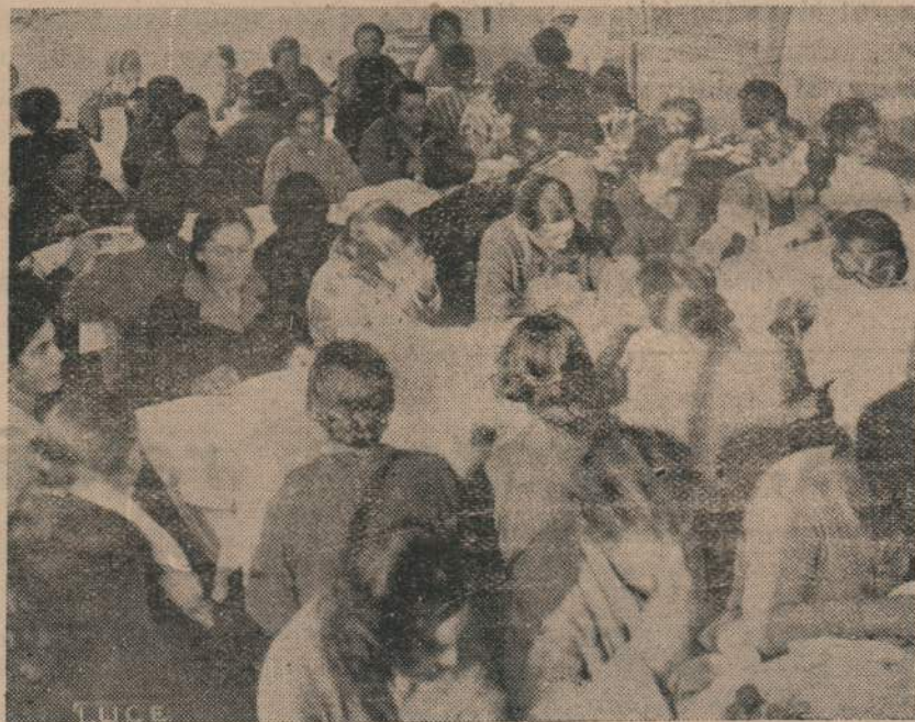
Las obras de Previdencia Social que realiza el Fascismo. — Asistencia a las Madres por el Instituto Nacional Maternidad e Infancia — (Foto "Roma Press" — Exclusivo para "EL ORDEN.")

media de ocho empleados (en el 1927 había 15 empleados y en el 1914, 11). Por cada mil toneladas-kilómetro virtuales, el consumo de carbón ha bajado de 78 kilos a 49,8 (antes de la guerra 53,9). Iguales mejoras se han verificado en la regularidad del servicio y en la seguridad de los transportes; en efecto las indemnizaciones comerciales que en el 1921-22 ascendían a 11 millones han ido bajando constantemente hasta cifras prácticamente insignificantes. El déficit que en el 1921-22 alcanzaba casi 1500 millones se ha reducido constantemente pasando a 1032 millones en el 1922-23 y a 421 en el 1923-24; en el 1925-26 el continuo progreso permitió llegar a una excedencia de 378 millones. A este período áureo siguió otro en el