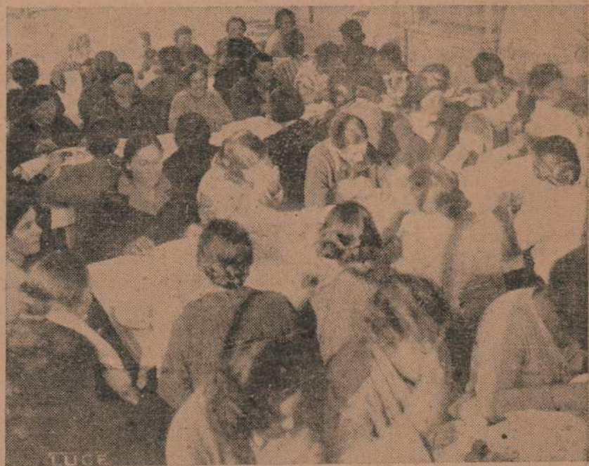
La obra fascista, comedores públicos gratuitos.

más desde las 10 a las 19 horas se habilitará al público los "box" de fieras y animales, para su exhibición, que amenizará la banda del circo.