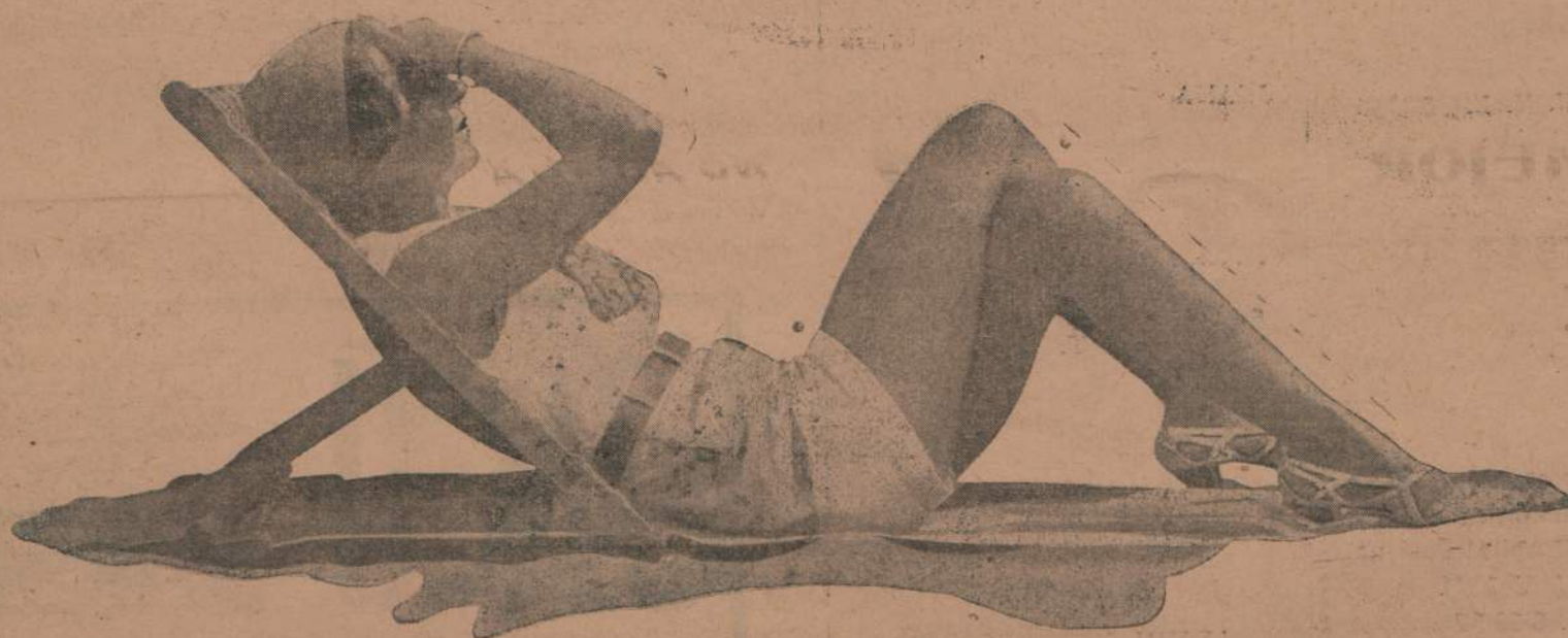
SILUETAS DE LA APLAYA